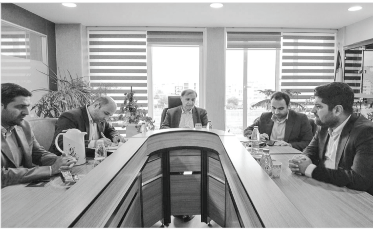
ارتباطات مردمی ۱۳۷ مورد توجه ویژه قرار و رفع اهداف مهم مدیریت شهری است و بیشتر مسائل