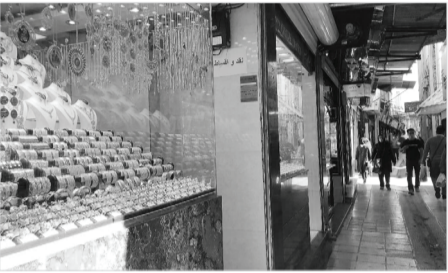
بازار فلز زرد